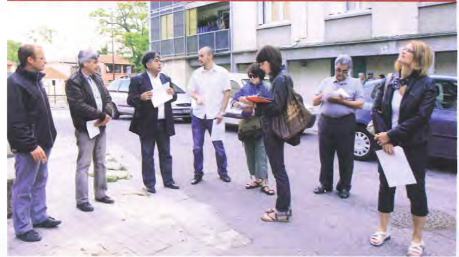
UNE RÉNOVATION URBAINE QUI A FAIT L'OBJET D'UNE LARGE CONSULTATION ET QUI S'ACCOMPAGNE D'ACTIONS DE PROXIMITÉ.

Réalisé sur l'ancienne place Jean-Philippe Rameau, le square des grands musiciens est un nouvel espace piéton réalisé en béton désactivé, un produit noble. Il est agrémenté de mobilier urbain, bancs et poubelles, ainsi que d'arbres de grande taille et d'un éclairage sur mât. Situé au cœur du quartier, ce square pourra accueillir les terrasses des futurs commerçants qui s'installeront en rez-de-chaussée des nouvelles résidences. La partie Nord de cet espace sera définitivement achevée après la construction de la résidence sociale Cassiopée que l'OPH réalisera en 2012.